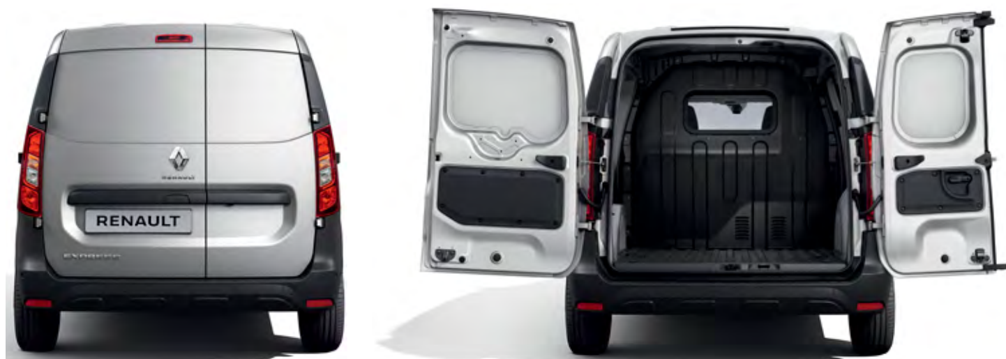
nákladový priestor vozidla Express Van