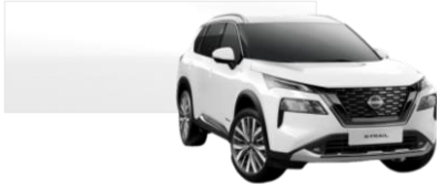
BIELA (QAK) (Bez príplatku)