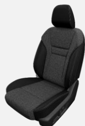
LÁTKOVÉ ČALÚNENIE ČIERNE (G)