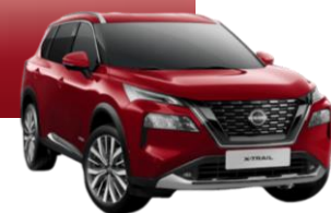
ČERVENÁ TINTED (NBL)