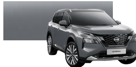
ŠEDÁ CERAMIC (KBY)