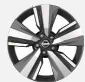
N-CONNECTA DESIGN PACK