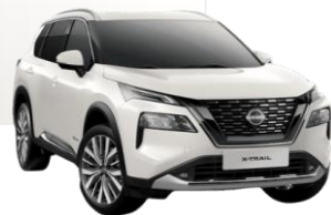
BIELA PEARL (QAB)