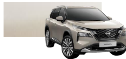
STRIEBORNÁ CHAMPAGNE (KAY)