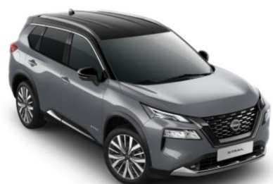
Sivá Ceramic - Čierna XEX - 1 350 €