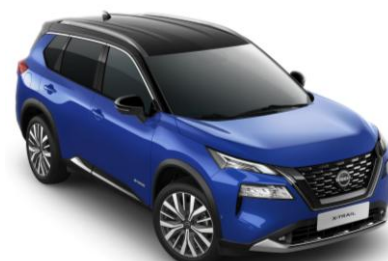
Modrá - Čierna XEU - 1 200 €