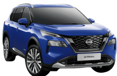
Modrá RBY - 700 €