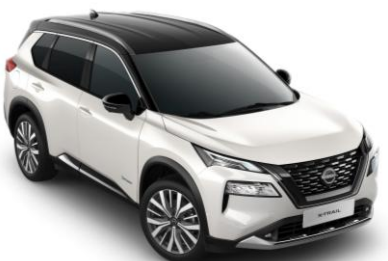
Biela Pearl - Čierna XKJ - 1 350 €