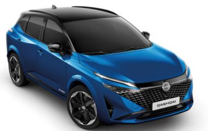
Modrá Magnetic a Čierna XGZ - 1000 €