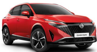
Červená Sunset NBV - 800 €