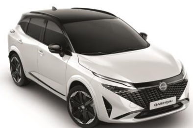
Biela Pearl a Čierna XKJ - 1000 €