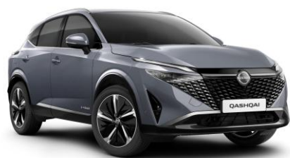
Sivá Ceramic KBY - 800 €