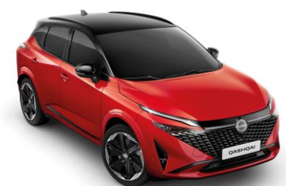
Červená Sunset a Čierna YAU - 1000 €