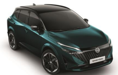
Zelenomodrá Ocean a Čierna YBJ - 1000 €