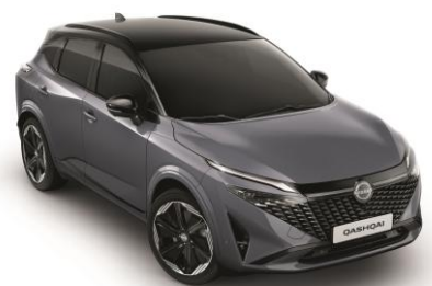
Sivá Ceramic a Čierna XEX - 1000 €