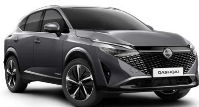
Sivá Gunmetal KAD - 600 €