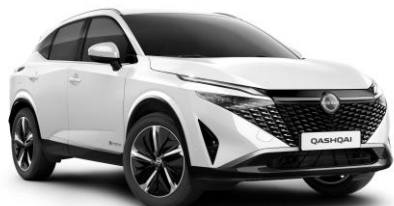
Biela Pearl QBE - 800 €