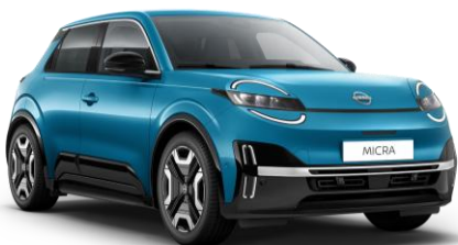
Authentic Modrá RCN – 300 EUR