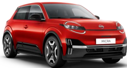
Červená Rebel NPT – 300 EUR