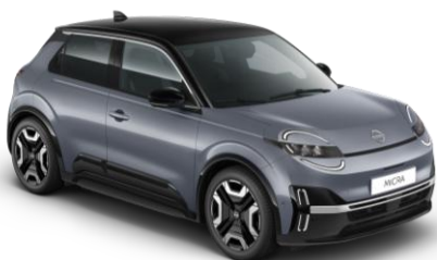
Elegant Strieborná / Čierna strecha YUY – 500 EUR