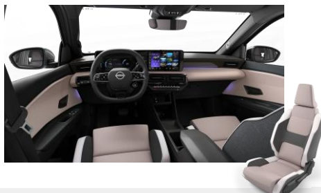
Zen Interiér 400 EUR