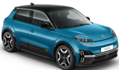
Authentic Modrá / Čierna strecha YZF – 500 EUR