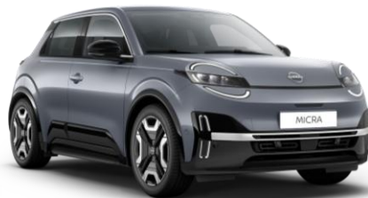
Elegant Strieborná* KQG – 300 EUR