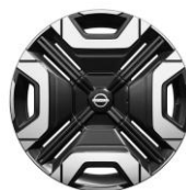
18" Ikonické disky z ľahkých zliatin