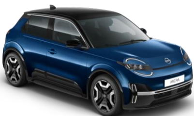
Marine Modrá / Čierna strecha YWW – 500 EUR