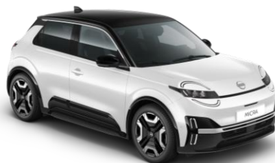
Bielel / Čierna strecha XUF – 500 EUR