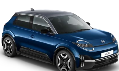
Marine Modrá / Strieborná strecha YWZ – 500 EUR