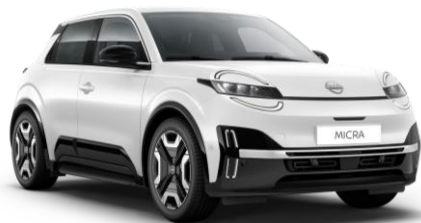
Bielel * 369 – ŠTANDARD