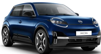
Marine Modrá RRE – 300 EUR