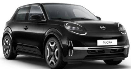
Mystery Čierna* GNE – 300 EUR