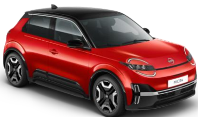
Červená Rebel/ Čierna strecha YZA – 500 EUR