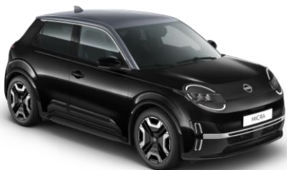
Mystery Čierna / Strieborná strecha YWX – 500 EUR