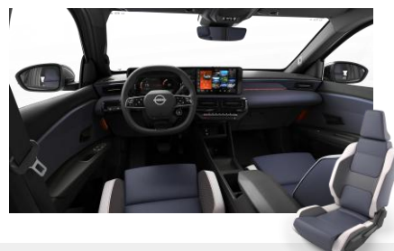
Športový interiér – Kožené sedadlá