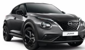
Sivá Gun KAD – 550 €