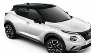
Biela Pearl / Čierna XKJ – 950 €