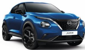
Modrá Vivid RCF – 550 €