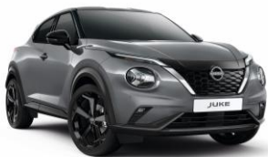
Sivá Ceramic KBY – 550 €