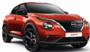
Červená Fuji Sunset NBV – 550 €