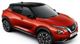
Červená Fuji / Čierna YAU – 950 €