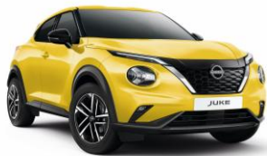
Žltá Icon ECE – 550 €