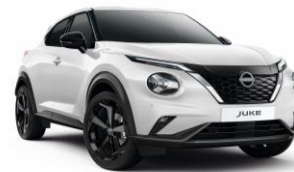
Biela Pearl QBE – 650 €