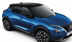
Modrá Vivid / Čierna XGZ – 950 €