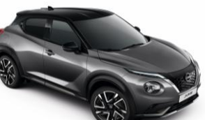
Sivá Gun / Čierna GAQ – 950 €