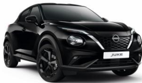
Perleťovo čierna GAT – 550 €