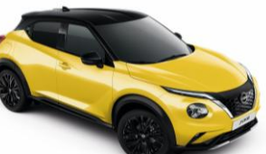
Žltá Icon / Čierna YAS – 950 €