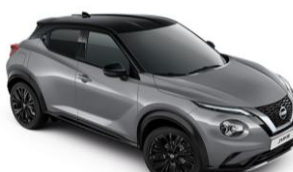
Sivá Ceramic / Čierna XEX – 950 €