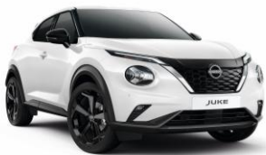
Biela 326 – 250 €