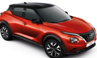
Red / Black (Midnight pack - 0 €) YAU - 950 €