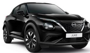
Pearl Black GAT - 550 €