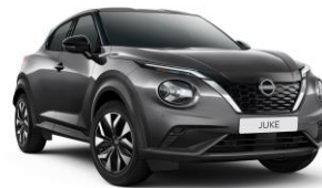
Gun Grey KAD - 550 €