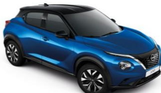
Blue / Black (Midnight pack - 0 €) XGZ - 950 €