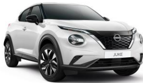
Pearl White QBE - 650 €