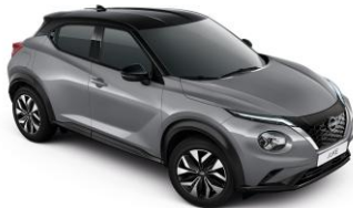
Grey / Black (Midnight pack - 0 €) XEX - 950 €