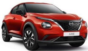
Fuji Sunset Red NBV - 0 €