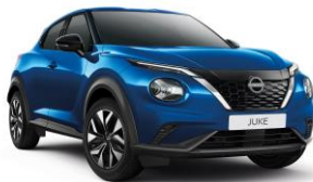
Magnetic Blue RCF - 550 €