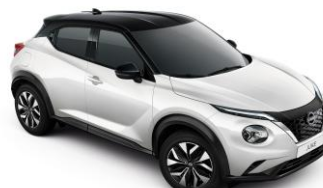
White / Black (Midnight pack - 0 €) XKJ - 950 €