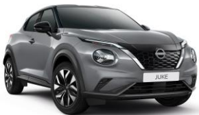
Ceramic Grey KBY - 550 €