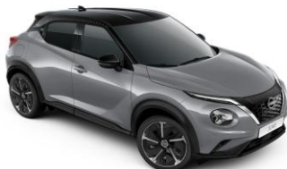
Grey / Black (PULSE) XEX - 0 €