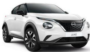
Solid White 326 - 250 €