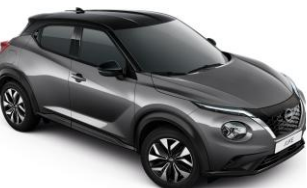
Dark Grey / Black (Midnight pack - 0 €) GAQ - 950 €