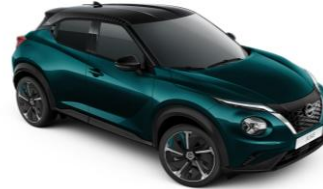
Deep Ocean / Black (PULSE) YBJ - 0 €