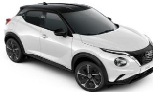
White / Black (PULSE) XKJ - 0 €